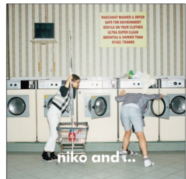
niko and ... ニコアンド ターゲット：25～35 歳の男女 国内店舗数：119 店舗 （15 年 5 月末）

その他スタディオクリップ、レプシムローリーズファームなど全 22 ブランドを展開しています。