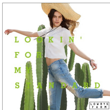
LOWRYS FARM ローリーズファーム ターゲット：20～30 代の女性 国内店舗数：140 店舗 （15 年 5 月末）