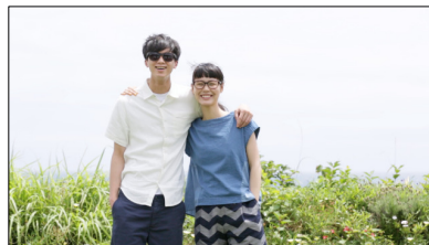
niko and ... ver.

発売日より「JINS × niko and ...」のコラボムービーをWEBで配信します。両方の視点から描いたドキュメンタリーテイストのムービーです。楽曲はGAKU-MCの新曲「希望のアカリ」が流れます。「8人の働く人」にフォーカスし、彼らのライフスタイルを描いた内容です。niko and ... ver.はこちらからご覧いただけます。 ( http://www.dot-st.com/nikoand )