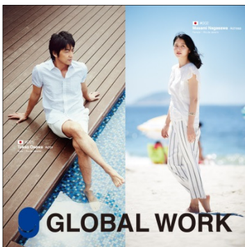
GLOBAL WORK グローバルワーク ターゲット：20～30 代の男女とキッズ 国内店舗数：181 店舗 （15 年 5 月末）