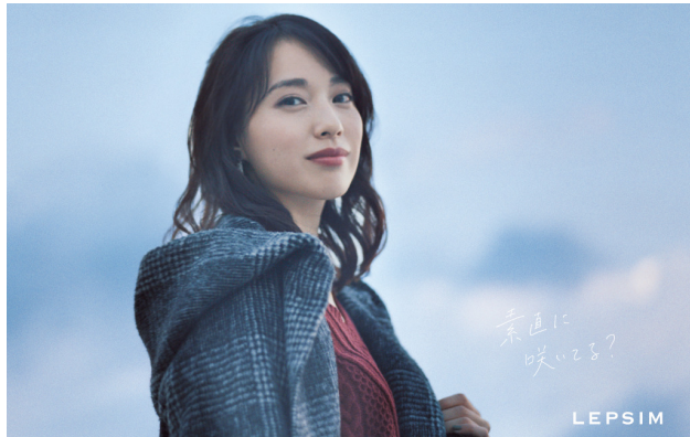
素直に笑える? 世界でいちばん幸せな魔女 ---WEBで公開---

ブランドキャラクターは、今秋より女優の戸田恵梨香（とだ・えりか）さんを起用しています。反響の大きかったキャンペーン第一弾のムービー「世界でいちばん偉大な魔女」に続き、今回キャンペーン第二弾として、戸田さんが演じ、アーティストの大橋トリオ（おおはし・とりお）さんが書き下ろした新曲で彩ったスペシャルムービー「世界でいちばん幸せな魔女」を、先行して10月31日（月）より配信開始いたします。