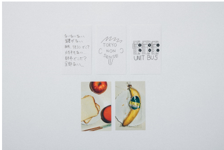
商品名：加賀美健×題府基之×HARE ステッカー 価格：¥700+tax