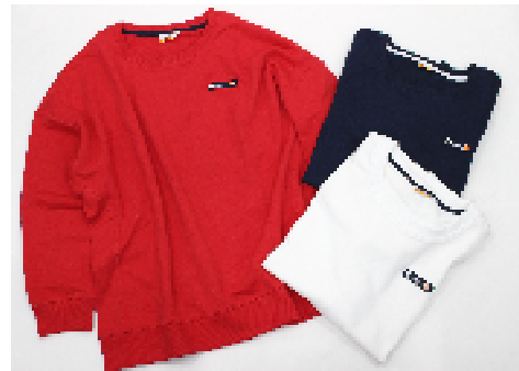
商品名 : ellesse/ウラケ POLS（スウェット） サイズ展開 : M・L 価格 : ¥6,500（税抜）、全3種