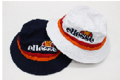
商品名 : ellese/バケットハット (ハット) 価格 : ¥4,500 (税抜)、全2種