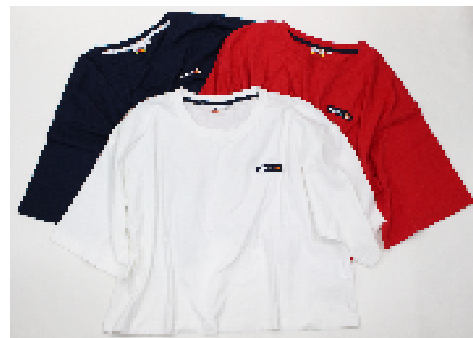
商品名 : ellesse/T シャツ SS（Tシャツ） サイズ展開 : M・L 価格 : ¥3,000（税抜）、全3種