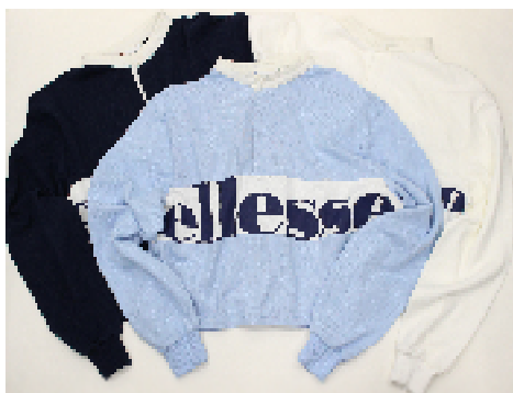
商品名 : ellesse/ラガー-SHLS（ラガーシャツ） サイズ展開 : M・L 価格 : ¥6,500（税抜）、全3種