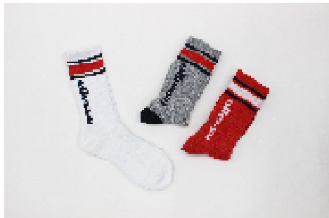
商品名 : ellese/ラインソックス(ソックス) 価格 : ¥1,200 (税抜)、全3種