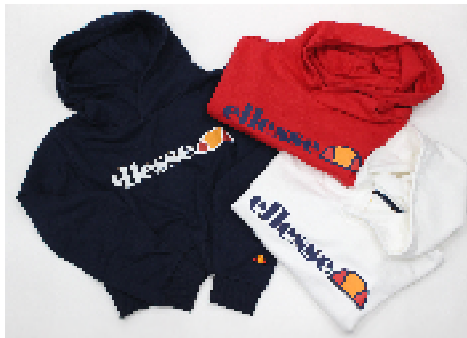
商品名 : ellesse/POPK/LS（パーカー） サイズ展開 : M・L 価格 : ¥5,500（税抜）、全3種