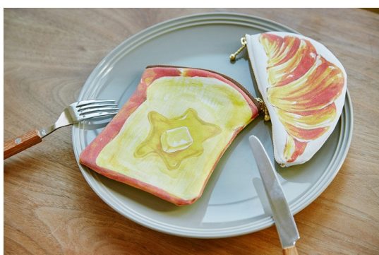
BAKERY パンポーチ ¥1200+税 BAKERY クロワッサンポーチ ¥1000+税