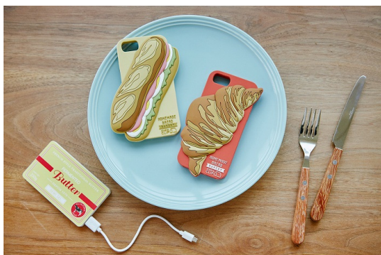
BAKERY 充電器 ¥2500+税 BAKERY 携帯ケース ¥1800+税