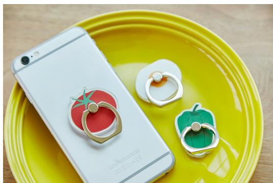
BAKERY アイリング ¥1200+税