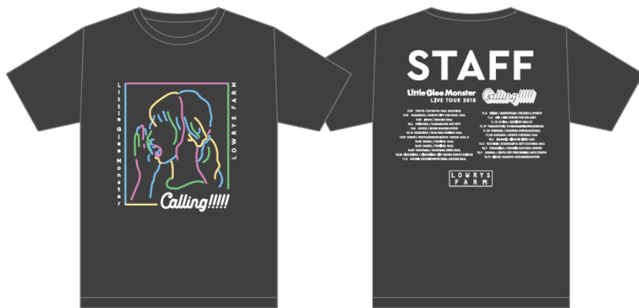
ツアースタッフTシャツ(会場スタッフ着用)

この度販売するTシャツのデザインは、今回のツアータイトル『Calling!!!!!!』をテーマに、女の子が叫んでいる様子がカラフルな色合いで描かれています。ツアー会場で着用されるスタッフTシャツを含め全4色を数量限定で販売します。