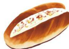
アップルシナモン