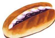
ブルーベリーレアチーズ