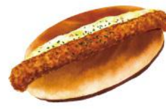
ひれかつタルタル

ライフスタイル提案型ブランドの「niko and ...（ニコアンド）」は、店舗併設のカフェ「niko and ... COFFEE」を展開しています。2016年11月にniko and ... COFFEEが提供するコッペパンサンド「ニコパン」を発売開始して以来多くのお客様にご好評をいただいております。