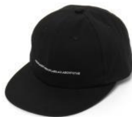
record/ CAP 金額 ¥3,240 (税込)