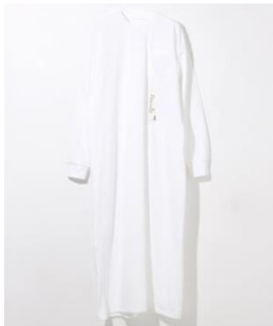
recorded/LSTシャツワンピース 価格 ¥7,020 (税込)