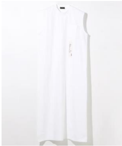
record /ビッグTシャツワンピース 価格 ¥6,480 (税込)