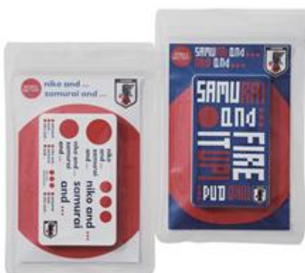
モバイルバッテリー 2,500 円+TAX