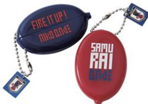
コインケース 650 円+TAX