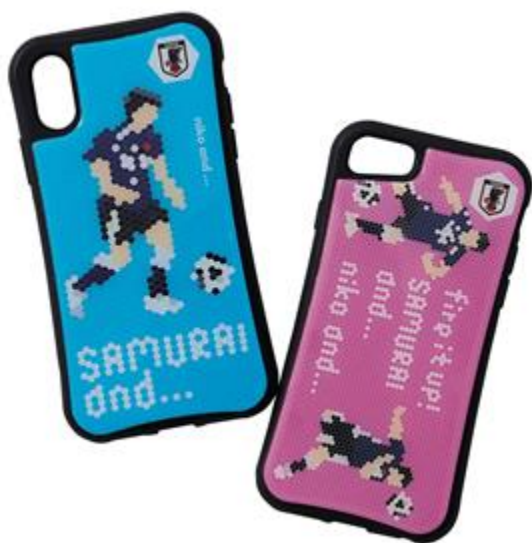
iPhoneケース 3,200 円+TAX iPhoneX,XS用(左) iPhone7,8 用(右)