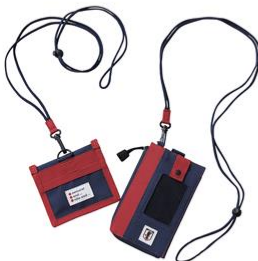
マルチケース(左) 2,200 円+TAX マルチケース(右) 3,800 円+TAX