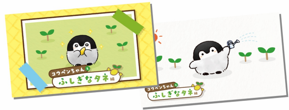
「コウペンちゃんとふしぎなたね」