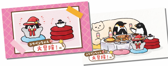
「コウペンちゃんの大冒険！」

キット購入時に、もれなくオリジナルマスクケースを1つプレゼント！ 「コウペンちゃんの大冒険！」/2種類の中からランダムで1種類 「コウペンちゃんとふしぎなたね」/2種類からランダムで1種類