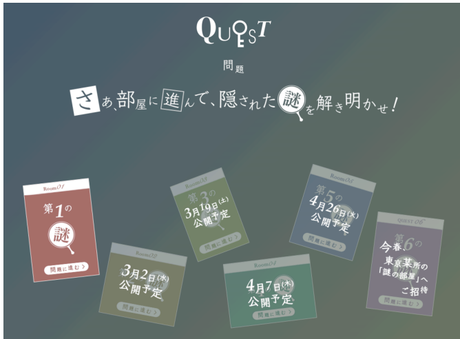
期間ごとに現れる6つの謎