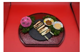
矢切ねぎの渡し (おじぎ茶屋)