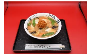
八幡平ポーク使用の 肉みそラーメン (とらや)