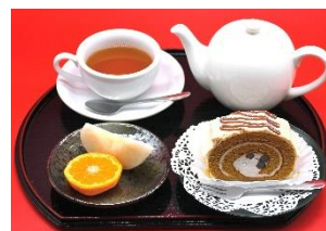
特産フルーツと黒糖ロールケーキのセット 和紅茶とともに (山本亭)