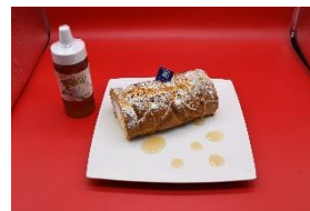
メープルの米米ロール ～国産りんごはちみつがけ～ (い志い)