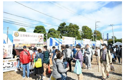
去年のブースの様子