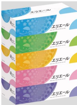
エリエールティシュー180組5個パック

エリエールブランドの大王製紙株式会社(住所:東京都千代田区富士見二丁目10番2号)は、きめ細やかな『なめらかさ』で鼻が赤くなりにくい『エリエールティシュー』を2015年10月21日より全国発売します。