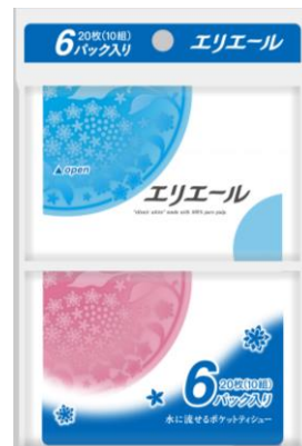
エリエールティシュー(ポケット)10組6個パック ※ポケットティシューのみ水に流せます。