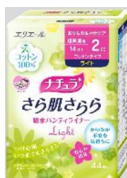
さら肌さらら 吸水パンティライナー (ライトコットンタイプ)

エリエールブランドの大王製紙株式会社(住所:東京都新宿区早稲田町70番1号)では、軽失禁ケアブランド「ナチュラ」において、「ナチュラさら肌さらら吸水パンティライナー(ライトコットンタイプ)」を追加ラインアップし、2013年3月21日より全国発売します。