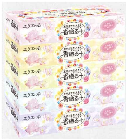
エリエール香織る+140組 5個パック

エリエールブランドの大王製紙株式会社(住所:東京都中央区八重洲2-7-2 八重洲三井ビル)は、香りつきティッシュの『エリエール香織る+(かおるプラス)ティッシュ』を様々な生活シーンで、家族みんなで普段使いできるティッシュに2014年4月21日よりリニューアル発売します。