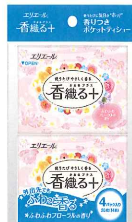
エリエール香織る+ポケット14組4個パック