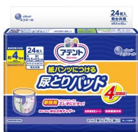
アテント 紙パンツにつける 尿とりパッド4回吸収 24枚

エリエールブランドの大王製紙株式会社(住所:東京都千代田区富士見二丁目10番2号)は、動いてもズレにくい安心感をご提供するため、「アテント 紙パンツにつける尿とりパッド 4 回吸収/6 回吸収」を平成 30 年 4 月 21 日(土)より全国リニューアル発売します。