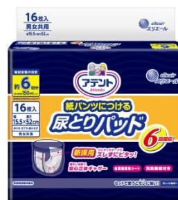
アテント 紙パンツにつける 尿とりパッド6回吸収 16枚