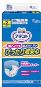
アテント 紙パンツ用尿とりパッド ぴったり超安心 2回吸収 48枚

大王製紙株式会社（住所：東京都千代田区）は、従来の「アテント紙パンツにつける尿とりパッド」を吸収回数毎のユーザーのニーズに対応した、「アテント紙パンツ用尿とりパッド ぴったり超安心」シリーズへ2018年9月21日（金）よりリニューアル発売します。