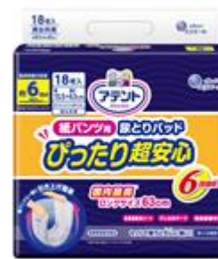
アテント 紙パンツ用尿とりパッド ぴったり超安心 6回吸収 18枚