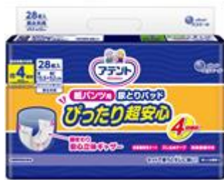
アテント 紙パンツ用尿とりパッド ぴったり超安心 4回吸収 28枚