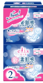
エリス新・素肌感 多い日の夜用 羽つき