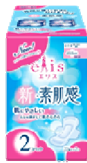
エリス新・素肌感 ふつう～多い日の昼用 羽つき