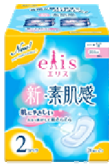
エリス新・素肌感 ふつう～多い日の昼用 羽なし

エリエールブランドの大王製紙株式会社(住所:東京都千代田区富士見二丁目10番2号)は、ムレが気になる生理中の肌にやさしい生理用ナプキン『elis(エリス)新・素肌感』を、2016年3月1日よりパッケージリニューアル(全商品)、品質の改善リニューアル(夜用商品)、入枚数の変更(昼用羽なし)を行い、発売します。