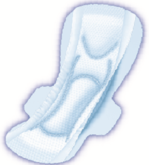
※製品イメージ図(29cm 羽つき)