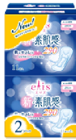
エリス新・素肌感 多い日の夜用 羽なし