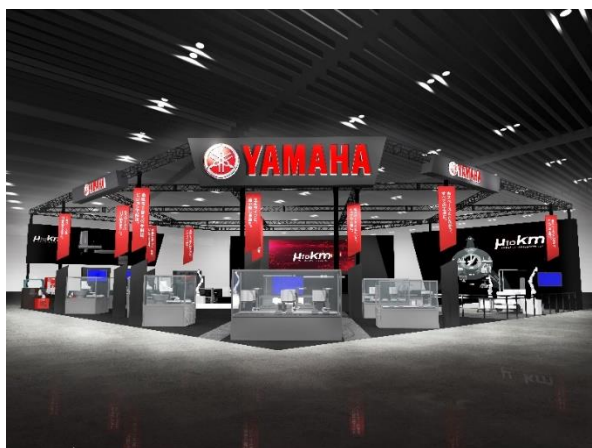
2023 国際ロボット展 ヤマハ発動機ブース（イメージ）