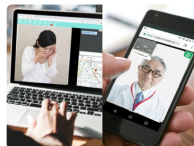
③医師と患者でビデオ通話がスタート

なお、オンライン診療を実施するための通信環境や端末を持たない医療機関に対しては、必要な通信機器を貸し出します。一定の期間においてシステム提供および機器の貸し出しを無償とすることで、医療現場への貢献につとめてまいります ※3 。