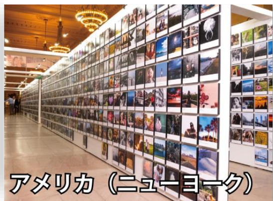
アメリカ (ニューヨーク)