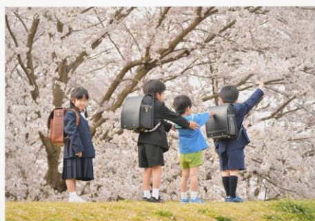
男の子 女の子 新生活がんばれー!!!