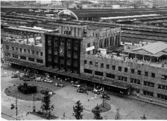
三代目大阪駅 (昭和 35 年撮影)