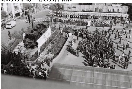
新橋駅前西口広場の S L 設置記念式 (昭和 47 年撮影)

<東京会場 展示作品> 港区オープンデータカタログサイト ( https://opendata.city.minato.tokyo.jp/ ) より