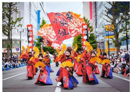
タイトル 皆の想いを繋ぎ舞う・・・ 出展者のメッセージ YOSAKOI 2022 旭川 華酔組 大変な状況の中 様々な想いを込めて 真剣に舞う気迫を 少しでもお伝え出来ればと・・・