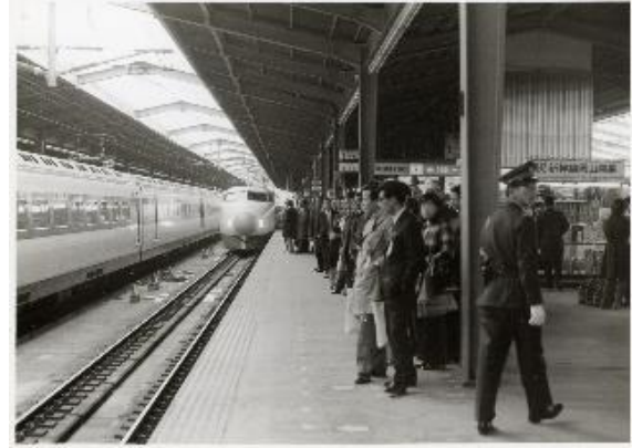
山陽新幹線岡山開業 当日の新大阪駅 (昭和 47 年撮影)