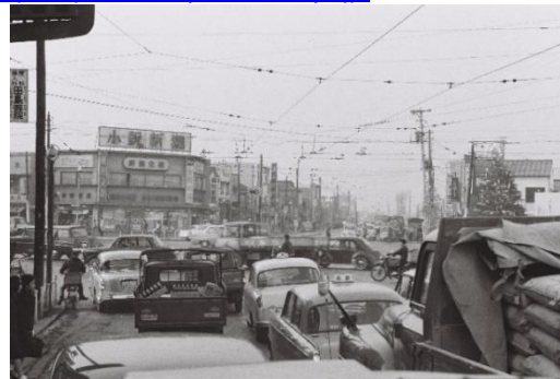
六本木交差点 (昭和 35 年撮影)