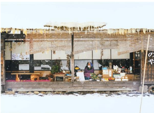
タイトル 会津のおばあちゃん 出展者のメッセージ 天使が舞い降りている様な美しい雪が降る3月の大内宿。夢で見た懐かしい風景に出会える事が出来ました。

テーマやジャンルを問わずに応募された「お気に入りの1枚」をお楽しみいただけます。