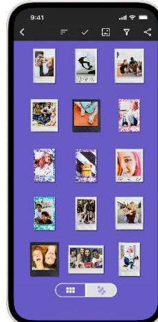
「リストビュー」モード