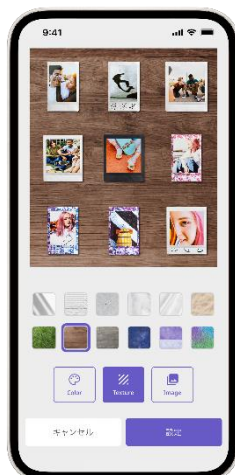
背景を自由にカスタマイズ可能

デジタルデータとしてスマホに取り込んだチェキプリントや作成したチェキプリントコレクションを、Instagram や LINE などの SNS に簡単に投稿することが可能。好きな背景と組み合わせた「フォトインフォト」や工夫を凝らしたオリジナルのコレクションを多くの人と瞬時に共有でき、チェキプリントの楽しみ方をさらに広げます。こだわって作成したコレクションも好きなサイズで切り出すことができ、スマホの壁紙にしたり、SNS にシェアすることができます。