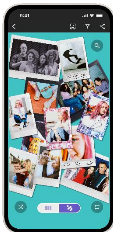
「ボックスビュー」モード

チェキプリントを左右均等に並べて一覧できるモードです。撮影日時順に並べたり、撮影場所やキーワードで絞り込んだりすることで、それぞれのチェキプリントが際立つコレクションに仕上がります。