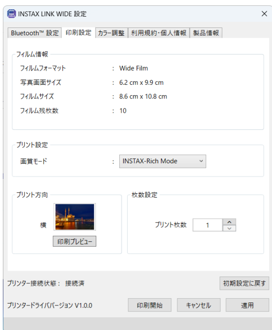
「Printer Driver」で 印刷設定している画面