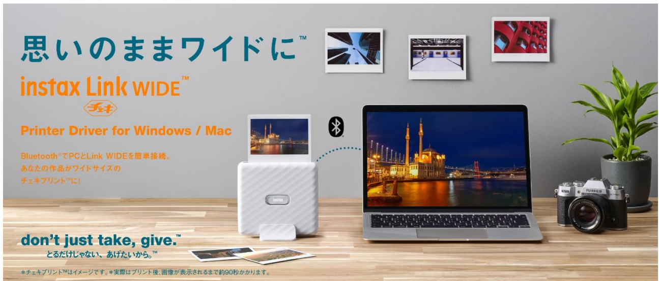
「instax Link WIDE™ Printer Driver for Windows / Mac」のキービジュアル

富士フイルム株式会社（本社：東京都港区、代表取締役社長・CEO：後藤 禎一）は、スマホプリンター“チェキ”™※1「instax Link WIDE™」（以下、「Link WIDE」）で PC の画像をチェキプリント™にできるプリンタードライバー「instax Link WIDE™ Printer Driver for Windows※2」（以下、「Printer Driver」）の提供を本日より開始します。「Printer Driver」により、簡単に PC からチェキプリント™にでき、“チェキ”™の楽しみをさらに広げます。尚、Mac※3 に対応した「instax Link WIDE™ Printer Driver for Mac」の提供は、2024 年秋を予定しています。