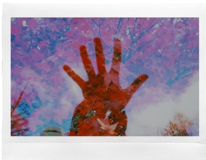
<フィルム：ビビッド×レンズ：二重露光>