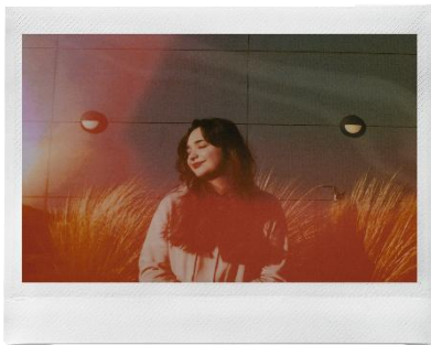
<フィルム：ノーマル×レンズ：光漏れ>