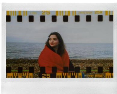
<フィルムストリップ>