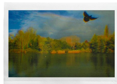
<フィルム：サマー×レンズ：色ずれ>