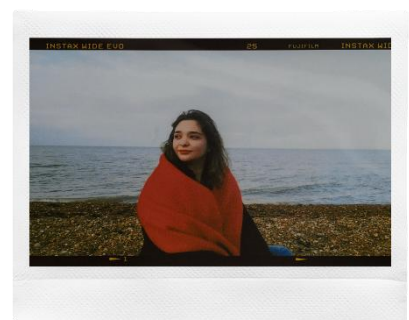
<コンタクトシート>