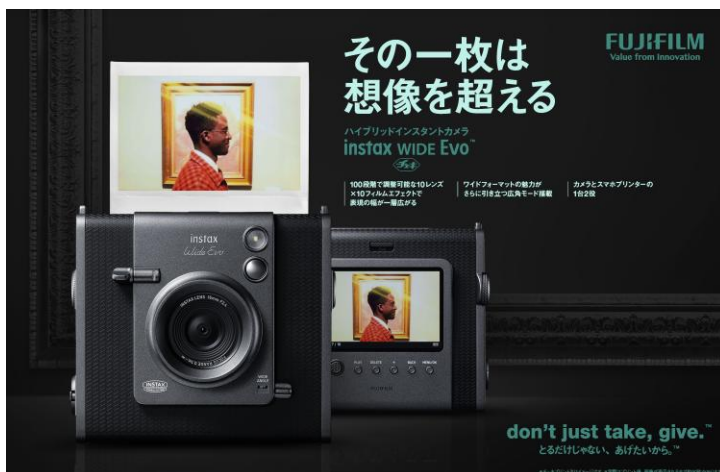
「WIDE Evo」のキービジュアル

今回、当社は「WIDE Evo」の本体カラーに合わせたカメラケースと、グラデーションで一枚ずつ異なる雰囲気メタリックなワイドフォーマットフィルム「BRUSHED METALLICS」を同時発売します。