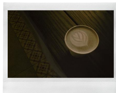
<フィルム：セピア×レンズ：ノーマル>