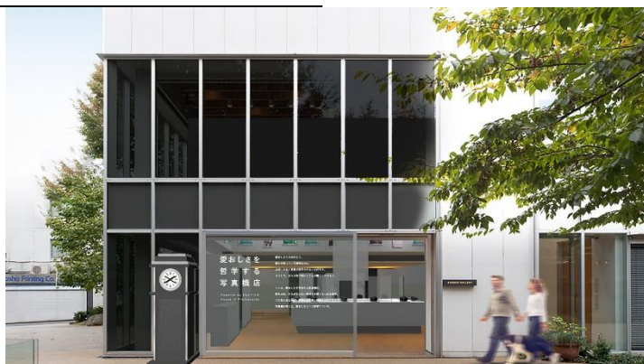
愛おしさを哲学する写真機店（イメージ）