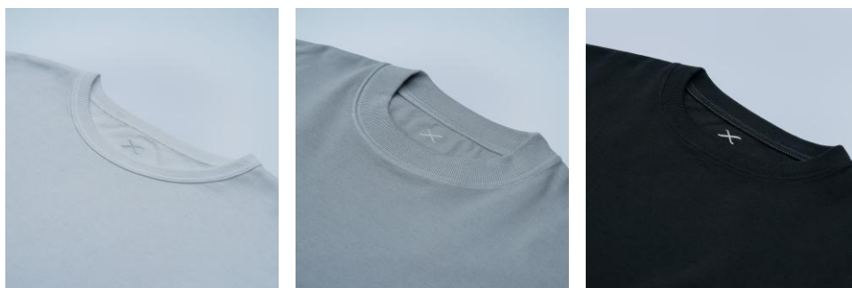
Xロゴ入りオリジナルTシャツ