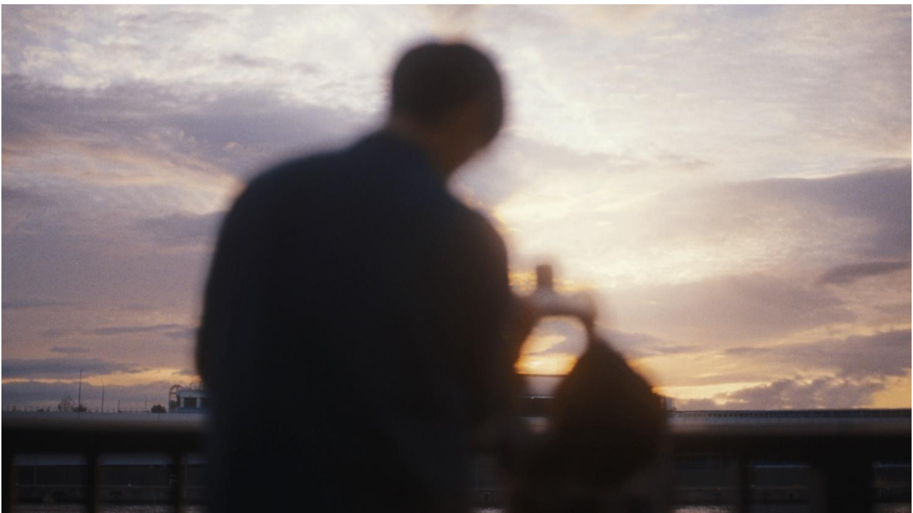
コンセプトムービー