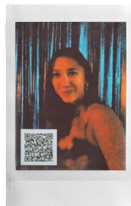
スマホ向け写真加工アプリを イメージした「2010」