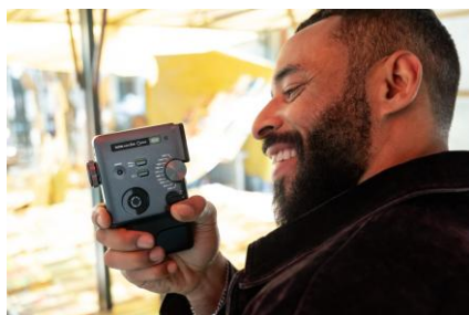
「mini Evo Cinema」での動画撮影を楽しむ様子

最大 15 秒までの動画を撮影可能。シャッターボタンを長押しして録画、離して一時停止というシンプルな操作で、複数のカットに分けながら撮影できます。撮影した動画はカメラ背面のモニターですぐに確認でき、プリントしたい場面を選んで、QRコード付きのチェキプリント™にしてその場で手渡せます。QRコードをスマホで読み取ることで、チェキフレーム付きの動画を再生したり、動画をダウンロードできます。ダウンロードした動画は手軽に SNS に投稿したり、友人とシェアして楽しめます。