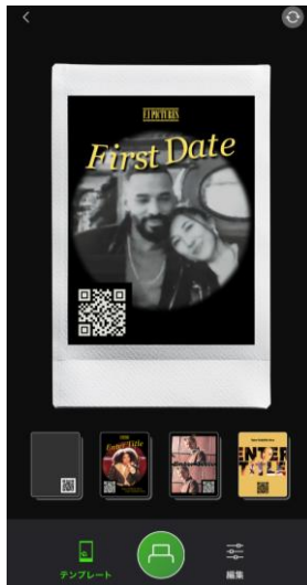
ポスターテンプレートを 選択する画面