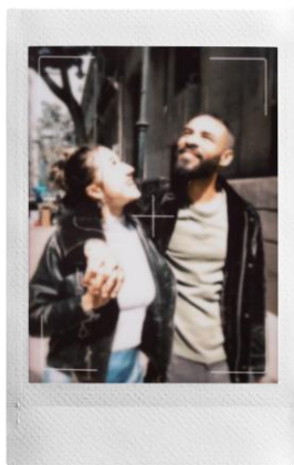
三色法の映像表現を イメージした「1940」