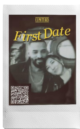
ポスターテンプレート を使用した作例