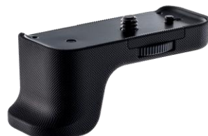
グリップアタッチメント