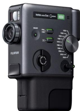
「mini Evo Cinema」本体