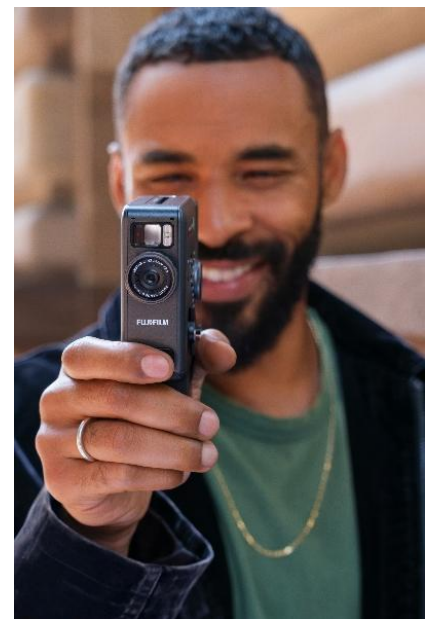
「mini Evo Cinema」のキービジュアル