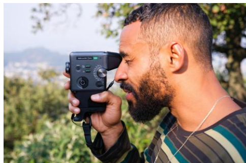
ファインダーアタッチメント使用時