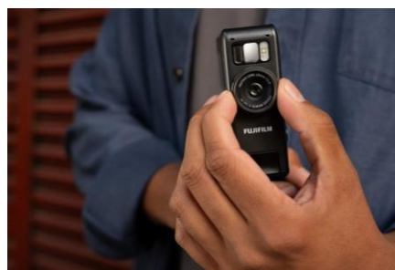
度合い調整ダイヤルを操作する様子