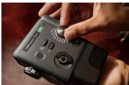
ジダイヤル™を操作する様子

1960 年代の 8mm フィルムカメラをイメージした「1960」や、1970 年代のカラーブラウン管テレビの質感をイメージした「1970」など、10 種類の「ジダイヤル™」エフェクトを搭載。映像の質感に加え、ノイズやテープ揺れなど、その時代をイメージした細かな効果を盛り込んでいます。エフェクトはそれぞれ 10 段階で度合いを調整でき、合計 100 通りの表現が可能です。また、収録される音声にも「ジダイヤル™」エフェクトが適用され、独特な音質の味わい深い動画に仕上げられるほか、一部のエフェクトでは、カメラの中でフィルムが回る音などの効果音が撮影中に流れ、まるで過去にタイムスリップしたような撮影を体験できます。