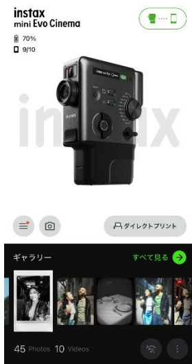
アプリトップ画面

専用アプリとの連携で、動画・静止画の撮影に加えて、スマホプリンターにもなる 1 台 3 役のカメラとして「mini Evo Cinema」を使用できます。