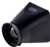
ファインダーアタッチメント