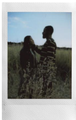
35mm カラーネガフィルムを イメージした「1980」