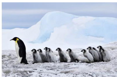
エンペラーペンギン / 南極