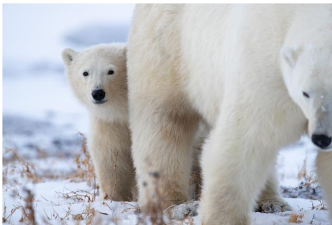
ホッキョクグマ / カナダ