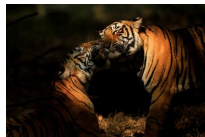
ベンガルタイガー / インド