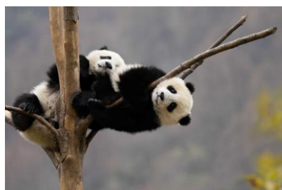
ジャイアントパンダ / 中国