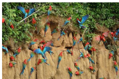
ベニコングウインコ / パルー