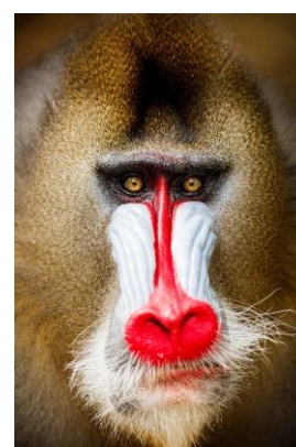
マンドリル / ガボン