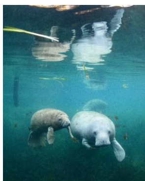
アメリカマナティー / アメリカ