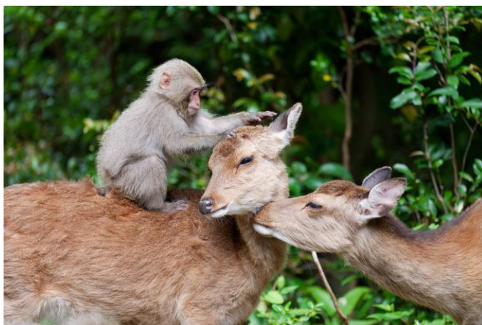
ヤクシマザルとヤクシカ / 日本