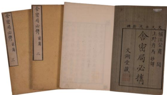
『舎密局必携 前篇』三卷（上野彦馬抄訳、1862年）