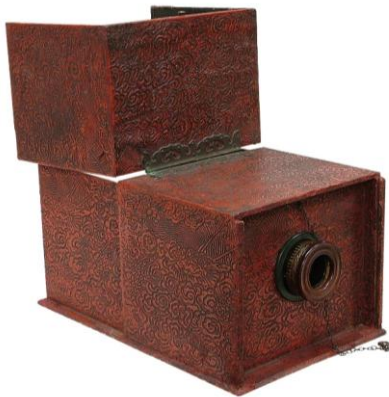
現存する日本最古のカメラ・オブスクーラ （江戸時代後期） 所蔵：富士フイルム株式会社