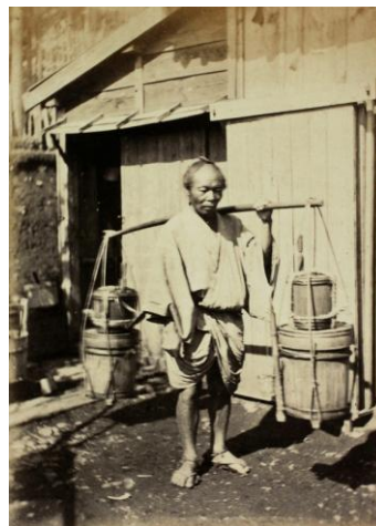
下岡蓮杖《醤油売り》写真貼付け英字新聞 『ザ・ファー・イースト』より 1870年代初め コロジオン湿板法で撮影、鶏卵紙にプリント