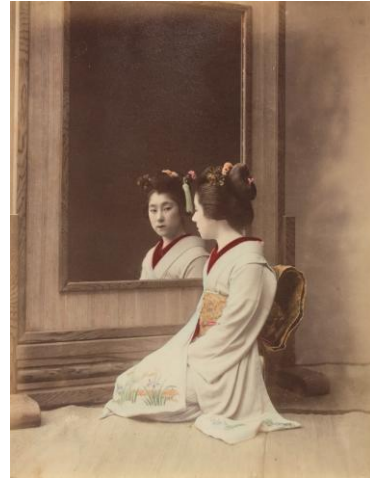
鹿島清兵衛《ぼん太》1895年頃 ガラス乾板 ii で撮影、鶏卵紙にプリント・手彩色 iii