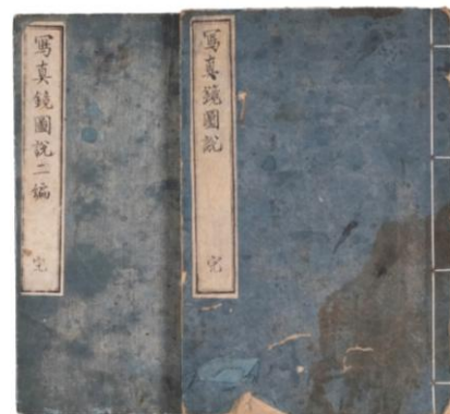
『写真鏡図説』二卷 （柳河春三訳述、初編1867年、二編1868年）