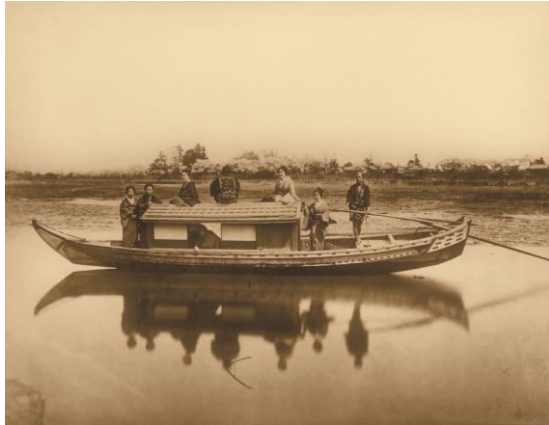
内田九一《隅田川の舟遊び》1872年 複製（発色現像方式印画）