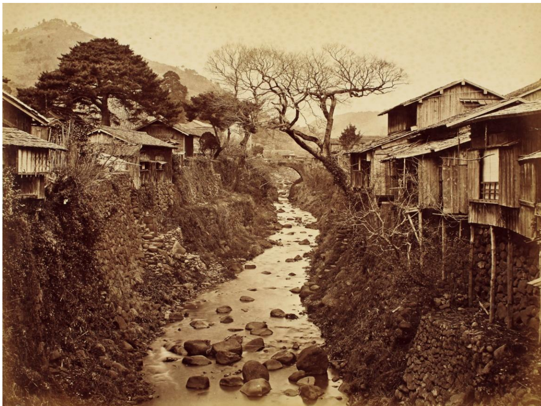
上野彦馬《長崎、中島川》1872年頃 コロジオン湿板法で撮影、鶏卵紙にプリント