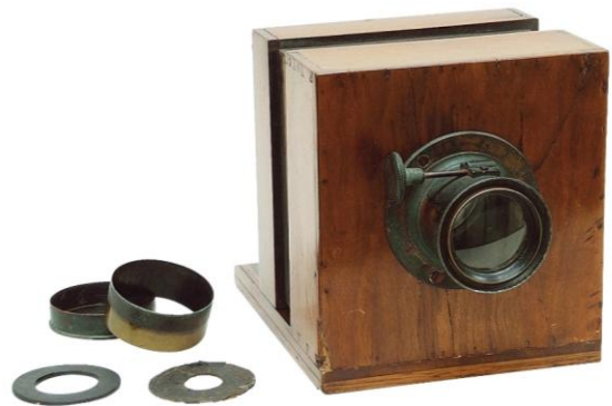
ダゲレオタイプカメラ（1840-50年頃） 所蔵：富士フイルム株式会社