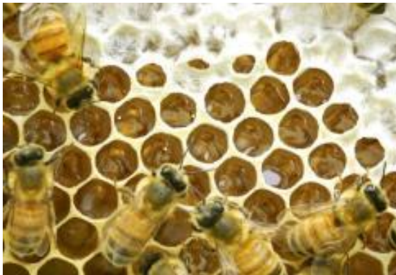
ミツバチが集めた花蜜は、 熟成・濃縮した後ワックスで蓋をする ©佐々木正己