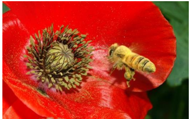
ヒナゲシでの花粉集め