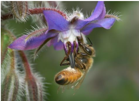
ボリジでの蜜集め