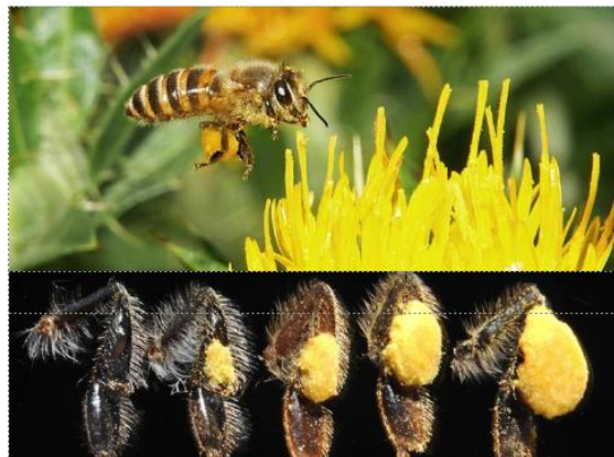
集めた花粉を飛びながらダンゴにする（上） 花粉ポケットに花粉ダンゴが成型されるまで（下）