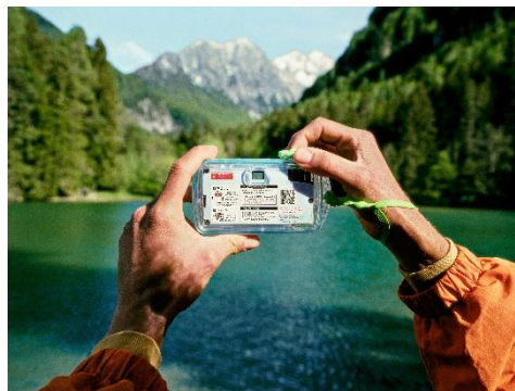
大きなフィルム巻き取りノブで簡単に操作