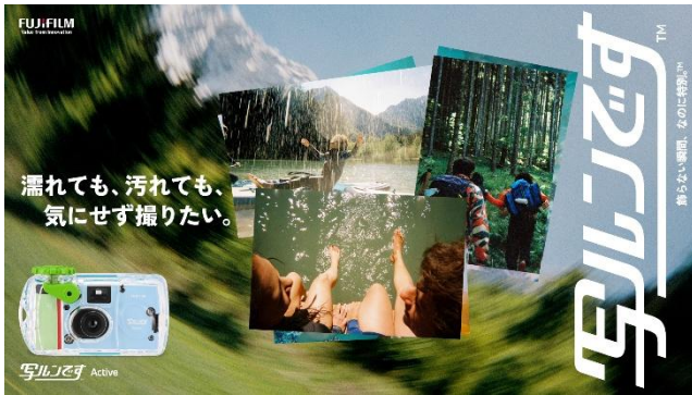
「写ルンです Active™」のキービジュアル

富士フイルム株式会社（本社：東京都港区、代表取締役社長・CEO：後藤 禎一）は、発売 40 周年を迎えたレンズ付フィルム「写ルンです™」シリーズの新商品として、防水モデルの「写ルンです アクティブ Active™」と黒白フィルムモデルの「写ルンです ブラック アンド ホワイト Black and White™」を発売します。「写ルンです Active™」は 2026 年 8 月上旬、「写ルンです Black and White™」は 9 月以降に発売予定です。