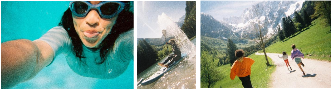
「写ルンです Active™」で撮影した作例

本体をプラスチックで覆うことで、水深 10m までの防水性を実現。海やプールなどの水辺はもちろん、ウィンタースポーツやキャンプなど、アクティブなシーンでの撮影に最適です。通常モデルより大きいフィルム巻き取りノブとレバー型のシャッターボタンを採用し、水中や手袋を付けているシーンでも簡単に操作できます。また、付属の「写ルンです Active™」専用ハンドストラップを取り付けることで、アクティブなシーンでも快適に撮影を楽しめます。