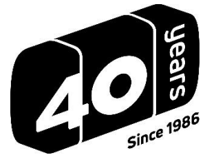
40周年 特別ロゴマーク

「写ルンです Active™」は水中での使用に加えて、雨や泥が気になる場所でも気兼ねなく持ち運び撮影を楽しんで欲しいという想いを「濡れても、汚れても、気にせず撮りたい。」というメッセージに込めました。グローバルには「Take it, Wherever」というメッセージで訴求していきます。「写ルンです Black and White™」は特別な設定や技術を必要とせず、黒と白の2色で写すことで、被写体を引き立てるアーティスティックな写真を撮影できることを「いつもの風景も、黒と白が引き立てる。」というメッセージに込めました。グローバルには「Refined by Black and White」というメッセージで訴求していきます。