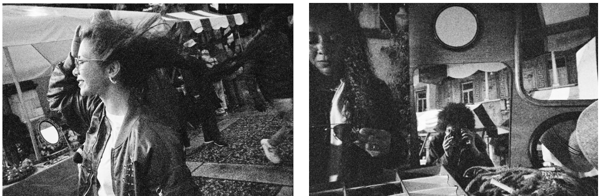
「写ルンです Black and White™」で撮影した作例

シャープで粒状感の滑らかな表現が特長の黒白フィルムを搭載。黒と白の2色で表現することで、特別な設定や技術を必要とせずに、街角のスナップや大切な人と過ごすひとときなど日常のワンシーンを被写体がより際立つ洗練されたアーティスティックな写真に仕上げることができます。