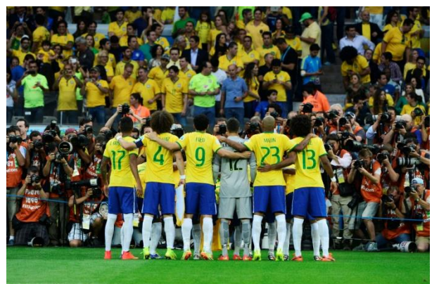
チームフォト撮影に臨むブラジル代表選手