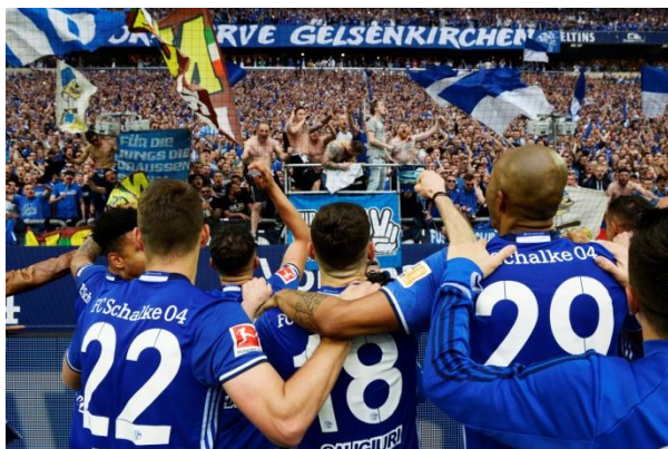
勝利の歓喜に包まれるシャルケの選手