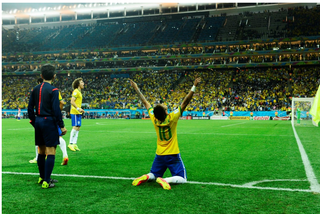
ゴールを喜ぶブラジル代表ネイマール