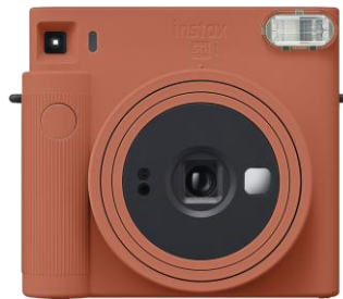
<テラコッタオレンジ>