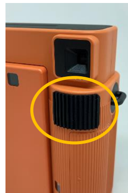
付属のグリップパーツで より撮影しやすく