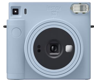
<グレイシャーブルー>