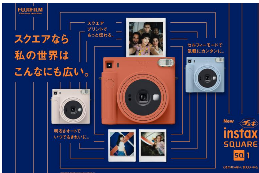
<新スクエアフィルム プリント画像>

また、フィルムのフレーム部分にさまざまなグラデーションが施され、一枚ごとに異なる色合いを楽しめる「RAINBOW(レインボー)」と、モノクロ写真でアーティスティックな写真表現を楽しめる「MONOCHROME(モノクローム)」のスクエアフィルム2種類も、同日に発売いたします。