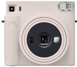
<チョークホワイト>