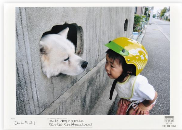
タイトル こんにちは! コメント 1才の息子は動物が大好きです。 自分より大きな犬でも怖くないんですね?