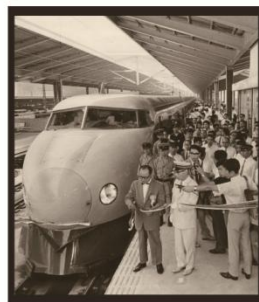
東海道新幹線の全線試運転で東京駅を出発する1号車(1964年)