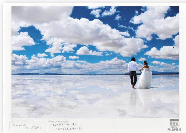
タイトル Honeymoon in UYUNI コメント 一生分の飛行機に乗り 一生分の絶景を見ました