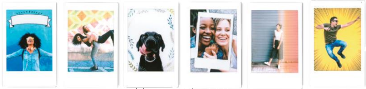
デザインフレームを使用した作例

カメラ本体にはあらかじめ10種類のデザインフレームを搭載しており、撮影時または撮影後に選択したフレーム付きでプリントが可能です。スマホ専用アプリ「instax mini LiPlay」をダウンロード(無料)していただくと、20種類のデザインフレームが追加でき、全30種類の中から気に入ったデザインフレームをご利用いただけます。