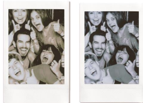
フィルター機能の作例 <セピア> <モノクロ>