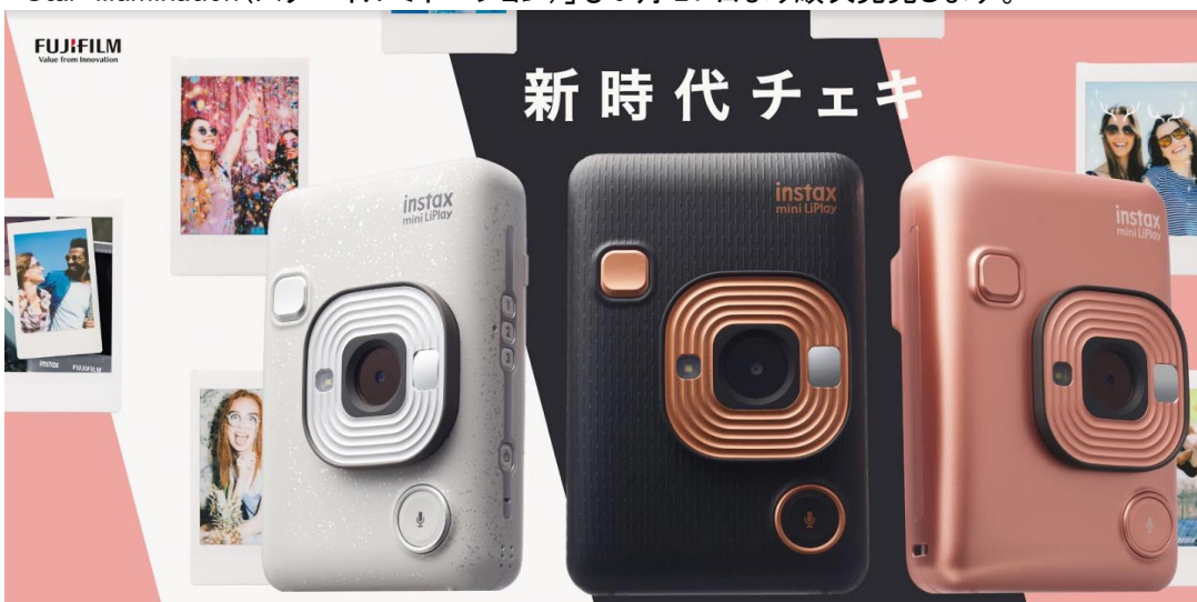
<QRコードつきプリント>

また、光沢のあるフレームで写真を華やかに見せるミニフィルム「CONFETTI(コンフェッティ)」と、スクエアフィルム「Star-illumination(スターイルミネーション)」も6月21日より順次発売します。