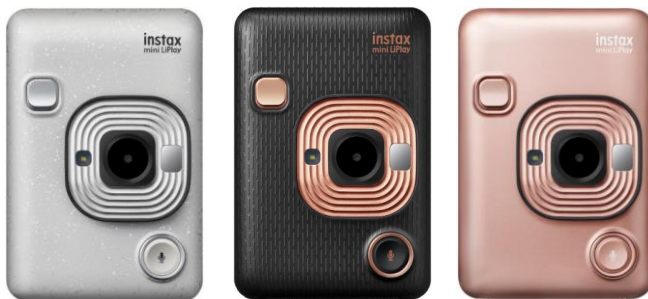
<ストーンホワイト> <エレガントブラック> <ブラッシュゴールド> (3色展開)

(1)ハイブリッドインスタントカメラ “チェキ”「instax mini LiPlay」