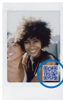
QRコードをスマホのQRコードリーダーで 読み取り再生します。