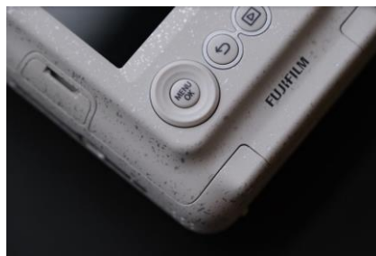
<飛沫塗装が特長的なストーンホワイト>