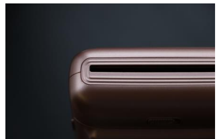
<滑らかさが際立つブラッシュゴールド>