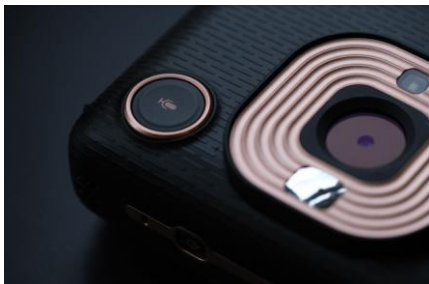
<凹凸加工が印象的なエレガントブラック>

シンプルな形状ながら、カメラ表面はカラーバリエーションごとに異なる加工を施し、手に取った時の感触にもこだわったデザインです。特殊な飛沫塗装で石のようにザラザラした肌触りが特長のストーンホワイト、カメラ表面の凹凸加工が印象的なエレガントブラック、光沢があり滑らかさが際立つブラッシュゴールドの3色をご用意しました。また、レンズリングなど随所にメタリックパーツを使用することで高級感のあるデザインに仕上げました。