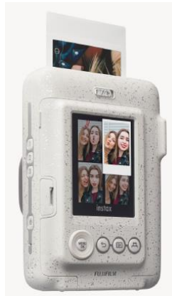
LCD モニターで 画像を確認可能