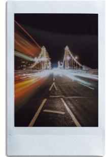
「バルブモード」で幻想的な表現に