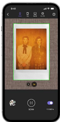
チェキプリント専用スキャン機能