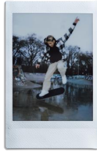
「スポーツモード」で早い動きでもブレを軽減