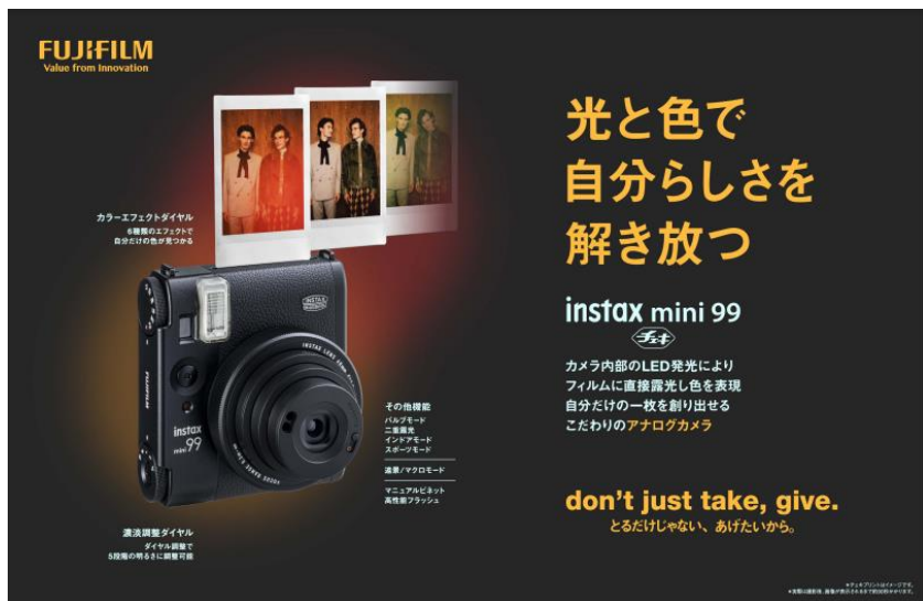
「mini 99™」のキービジュアル

今回、当社は「mini 99™」の本体カラーに合わせたカメラケースとミニフィルム用フォトアルバムの新色（ブラック）も同時発売します。また、写真フィルムの現像で使用する「マウント」をモチーフにし、「mini 99™」のプリント表現をさらに際立たせる、ミニフォーマットフィルム「PHOTO SLIDE」 フォトスライド も今夏発売予定です。