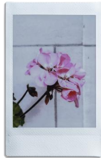
「マクロモード」で近くのものもシャープに撮影