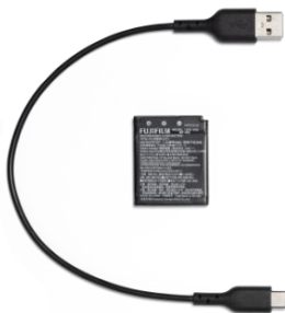
左から「充電ケーブル」「充電式バッテリー」「バッテリーチャージャー」「三脚穴付きボトムグリップ」