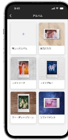
「アルバム機能」で複数のコレクションを作成・整理