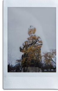
「二重露光」で風景と人物を重ねてクリエイティブな作品に