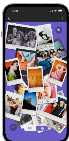
「ボックスビューモード」画面