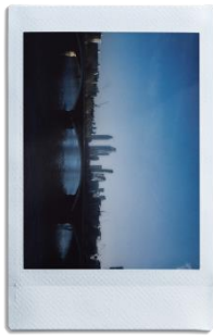
「遠景モード」で風景も