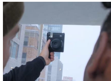
「三脚穴付きボトムグリップ」を装着し、セルフイーもしやすく

※4 三脚使用時にフィルムを交換する場合は、必ず付属の三脚穴付きボトムグリップをカメラに装着する、もしくは、三脚からカメラを外してください。