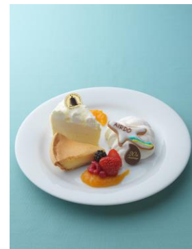
「奇跡の口どけセット ～AIRDO×LeTAO20th～」 ふわふわな生ドゥーブルと滑らかなヴェネチアランデヴーにミルク感たっぷりのオリジナル生クリームを添えてよりミルキーで口どけ豊かなセットになっています。