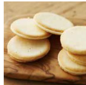
「小樽色内通りフロマージュ」 チーズ、バター、チョコレートが調和した ラングドシャクッキー