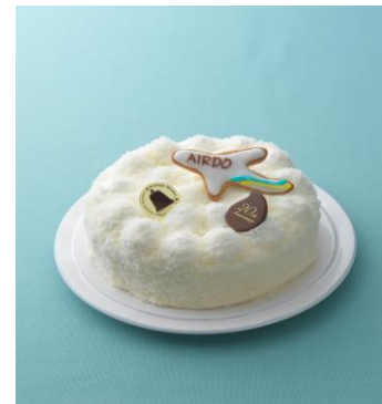
「エア・ドゥーブル」 ミルキーでふわふわの生ドゥーブルとエア・ドゥの空をイメージしたドゥーブルフロマーージュです。

また、ルタオ本店2階の喫茶では、人気NO.1の「奇跡の口どけセット」をこの日限りの限定仕様で100セットご用意しております。