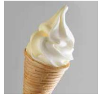
「クレームグラッセ マリアージュ」 北海道産ジャージーミルクを使用した ソフトと、チーズソフトのミックス