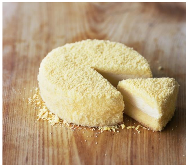
ドゥーブルフロマーージュ