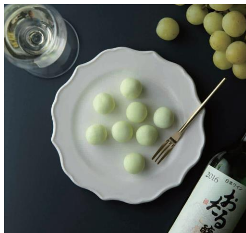
ナイアガラ ショコラブラン フレ 内容量：8個入り 価格：864円（税込）