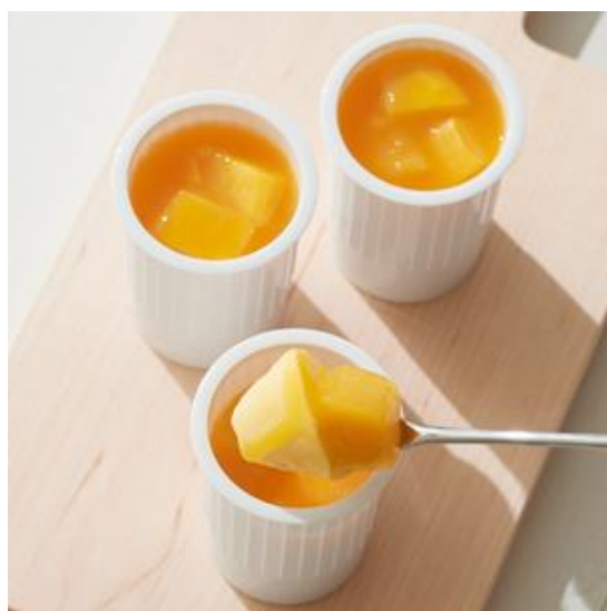
ヴェリーヌ マングーパッション