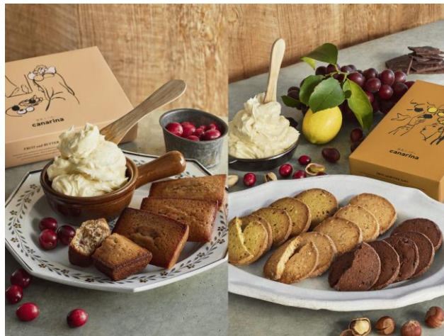
画像左: 果実とバターのフィナンシェ クランベリーバター 画像右: 果実とバターのサブレ

「みんなが贈りたい。JR 東日本おみやげグランプリ 2024」(以下: おみやげグランプリ 2024)にて総合グランプリを受賞した『果実とバターのサブレ』他、しっとりとした口当たりと果実感が好評の『果実とバターのフィナンシェ クランベリーバター』、サブレとフィナンシェを詰め合わせた『カナリナ セレクション』をご用意いたしました。