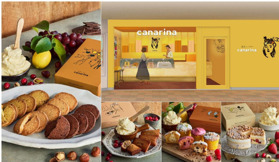
< 「イイトルミネ」にオープンする新店舗イメージと、販売する4つの商品ラインナップ >