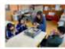
※専門講師、地域の方