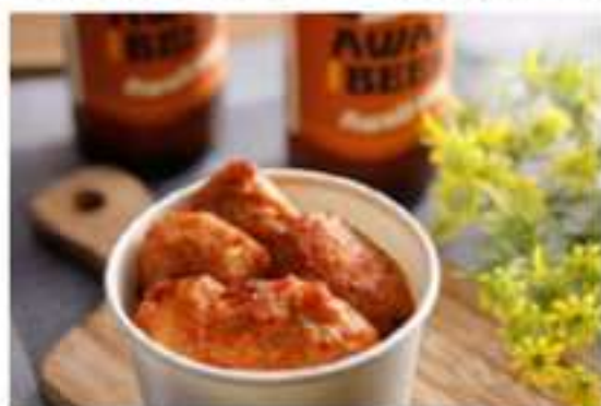
「島ハモ梅ナゲット」(鱧すき風の味付け)