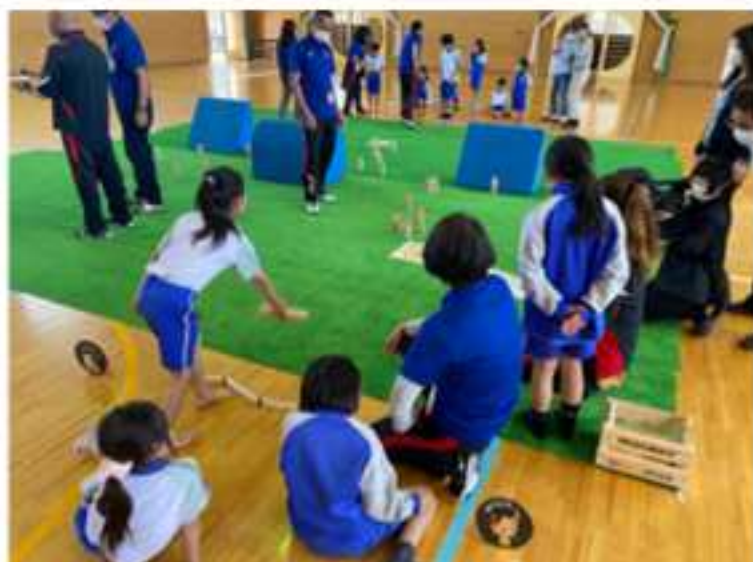
地域の人と一緒に教えてくれます 【モルック（ユニバーサルスポーツ）】

本事業の最大の特徴は、地域住民が「まちの先生」として講師を務める点にあります。将棋、ウクレレ、書道、茶道といった趣味や特技を活かした講座から、プログラミングや動画制作、ダンス、球技、武道、ユニバーサルスポーツなどの専門的な学びまで、地域の多様な人材が子どもたちと関わっています。地域の方々が趣味や特技を生かし関わることで、子どもたちだけでなく、大人自身も生きがいや楽しさを感じ、学ぶ楽しさを実感できる「共育（共に育てる）」と「共学（共に学ぶ）」のサイクルが生まれています。