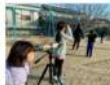
※専門講師、地域の方