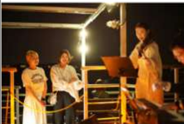
船上でのバイオリンとピアノの生演奏