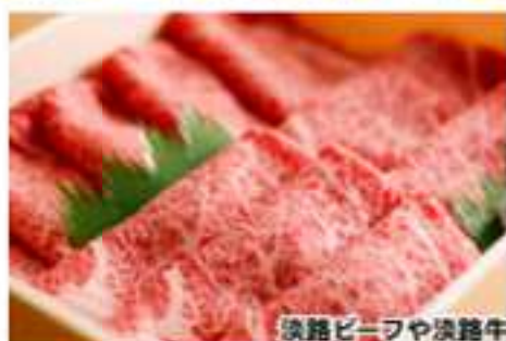
淡路ビーフや淡路牛