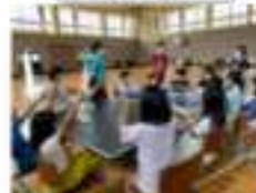
※専門講師、地域の方