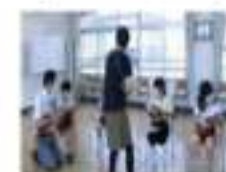
※専門講師、地域の方