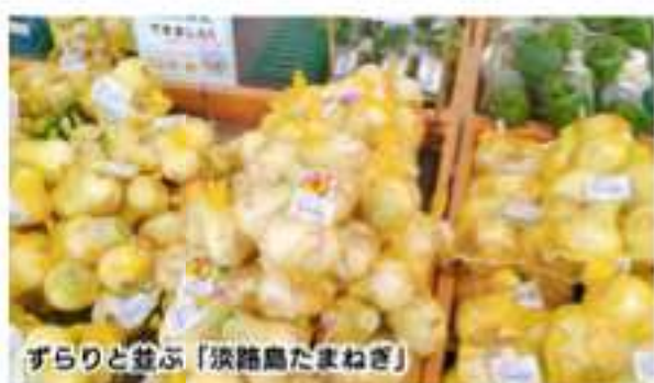
ずらりと並ぶ「淡路島たまねぎ」