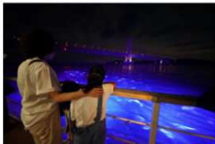
幻想的に照らされた海面、大鳴門橋