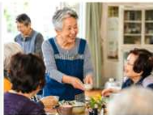
地域で役割やつながりを持ち、支え合う