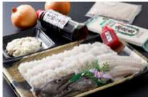
お取り寄せでも「鱧すき」を味わえます