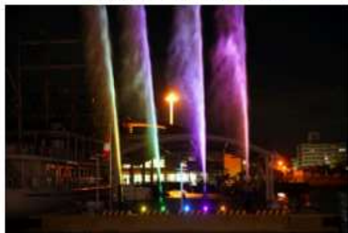
出航の際の放水ライトアップ