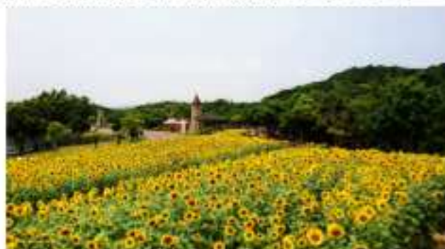
モニュメントひまわり畑 7月中旬見ごろ予定

※ひまわりは短命のため、見頃期間が短く咲き始めてから、約10日間ほどしか楽しめません。(天候状況により変動致します。開花状況はご来園前にお問合せください。)