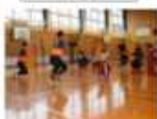
※専門講師、地域の方