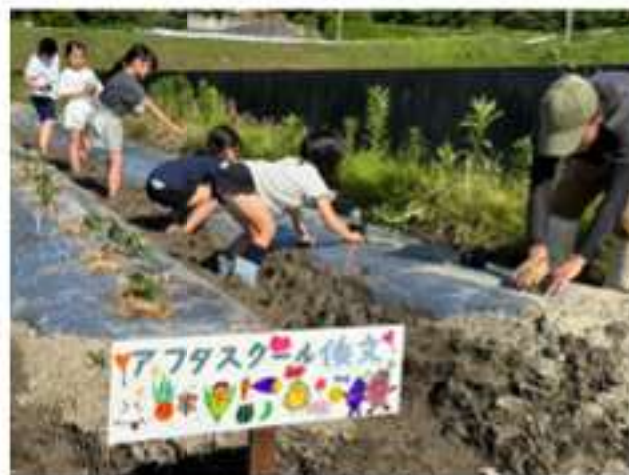
自分たちのおやつは、自分たちで作る！ （アフタースクール後文農園）