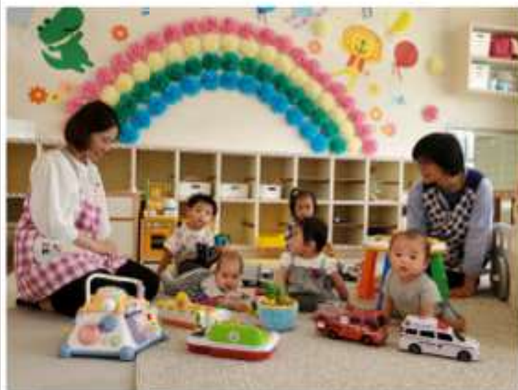
子育て学習・支援センター（通称：ゆめるんセンター）