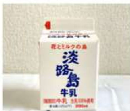
学校給食に出てくる淡路島牛乳200ml

兵庫県南あわじ市で牛乳・乳製品を製造販売している淡路島牛乳株式会社です。このたび、当社商品「淡路島牛乳200ml」の広告欄に淡路島を拠点にするサッカークラブ「FC.AWJ」のチームロゴを掲載します。淡路島牛乳200mlは淡路島内の学校給食で提供されており、給食の時間を通じて小中学生にFC.AWJの浸透が期待されます。掲載開始は6月中旬を予定しています。