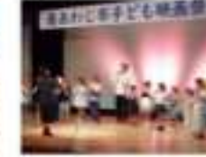
※専門講師、スタッフ