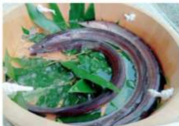
夏が旬の鱧（ハモ） （はも道中の鱧）

2026年 夏の淡路島の風物詩！ 淡路島の鱧グルメ最新情報！ 郷土料理とも言える定番メニュー「鱧すき」コース料理から お気軽メニュー「ハモ天井」まで！ ～いろんな鱧料理を食べに、淡路島へ遊びに来てください～