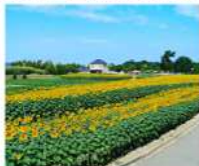
メイン5万本のひまわり畑は8月中旬見ごろ予定 (2,200㎡)