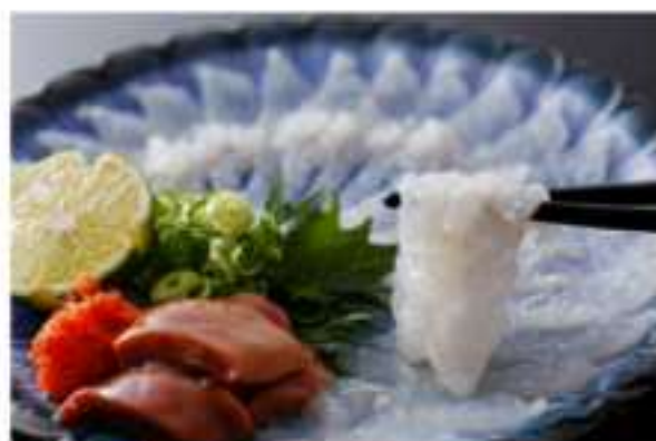
「はもの薄造り」(薄造りの骨切は熟練の技。