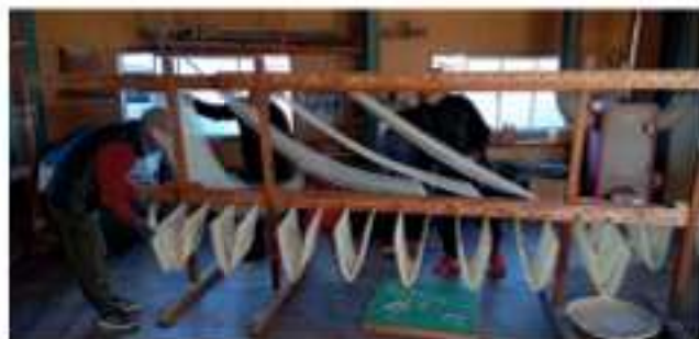
淡路手延べそうめん製造作業 ～門干し～