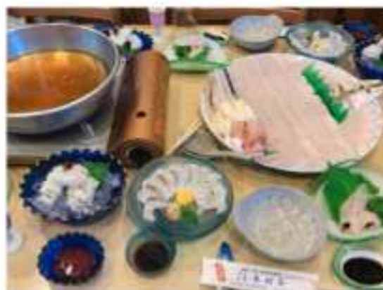
【王道料理】「鱧すき（鍋）」コース料理