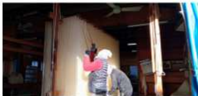
淡路手延べそうめん製造作業 ～はた掛け～

兵庫県南あわじ市の特産品である「淡路島手延べそうめん」が、農林水産省の「地理的表示（GI）保護制度」に登録されました（登録番号 第176号）。天保年間（1830～1843年）、福良の漁師・渡七平が伊勢参りの帰りに三輪地方でそうめん作りに出会い、2年間の修業を経てその技を故郷に持ち帰ったことが始まりとされています。以来、約190年にわたり、冬の厳しい海風を活かした独自の製法が守り抜かれてきました。