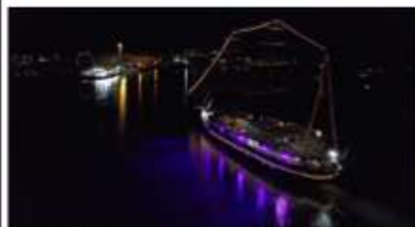
夜の鳴門海峡に出航する遊覧船「咸臨丸」