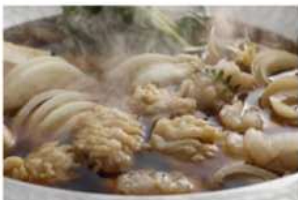
「鱧すき（鍋）」出汁とたまねぎの甘味・旨味が絶妙