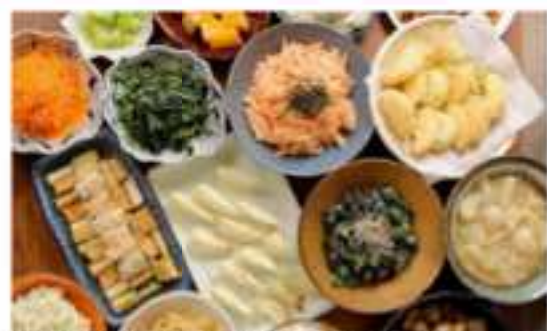
淡路島の食材をふんだんに使ったおばんざいメニュー

淡路島の地産地消を体感できる場所として、兵庫県最大級の産直市場「美菜恋来屋（みなこいこいや）」の2階にあるレストラン「収穫食祭（しゅうかくしょくさい）」をご紹介します。