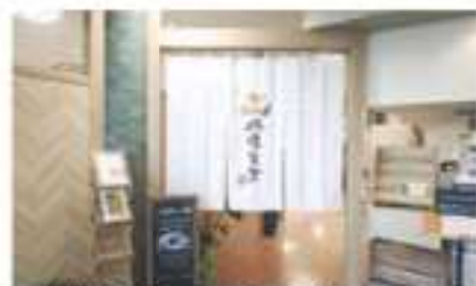
建物2階のこののれんが目印です