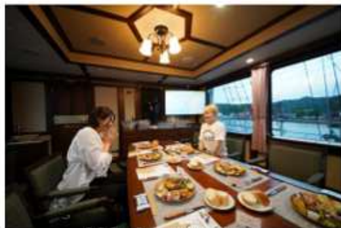
貴賓室で味わう「淡路島の美食」