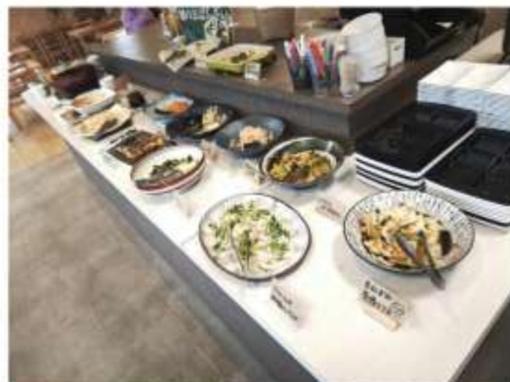
女性店長さんがいろんな食材を使って作っている畑のおばんざいビュッフェ