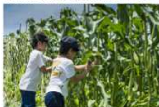
トウモロコシの収穫体験 (6月中旬以降)