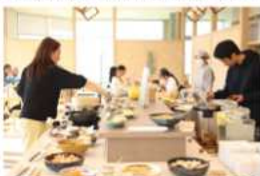
淡路島のおばんざい15品＋サラダ・ご飯・パン・お汁物・デザートなどが食べ放題!! （おばんざいの内容は季節によって変わります）

生産する人、販売する人、調理する人、そして食べる皆さんの食への思いがめぐる場所で、島の恵みを再発見しませんか？