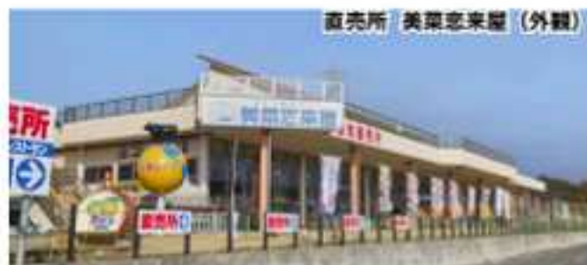
直売所 美菜恋来屋（外観）