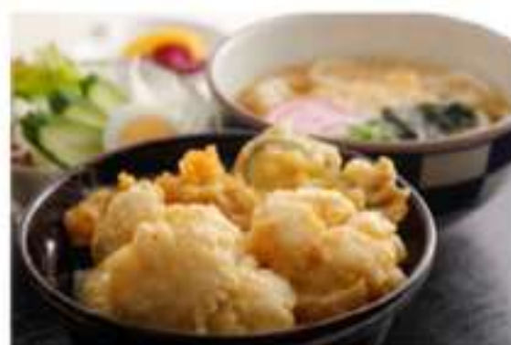
「ハモ天井」大きな鱧の身と玉ねぎや野菜の 天ぷらがのったボリューム満点の天井

この度は、淡路島の夏の風物詩であります「鱧」のシーズンに、南あわじ市内の料理人達が、淡路島の王道鱧料理の「鱧すき（鍋）」の他に『気軽に楽しんでもらえるカジュアルなハモ料理』や創作鱧料理を開発しました。