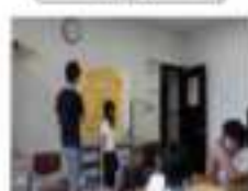
※専門講師、地域の方