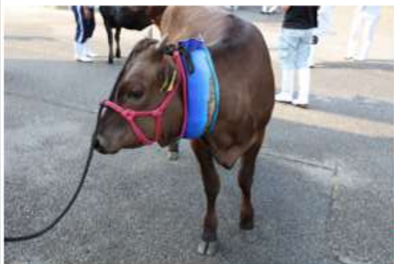
暑さ対策に「ネッククーラー」する牛も見られるかも・・・

こんな取材が可能です ：月齢に応じた発育状態（体高・胸囲測定）、栄養度管理、美点・欠点の確認に加え、産産長寿につながる育成牛の肢蹄管理の重要性、母系や血統の特徴などについて、実際に牛を見ながら指導をおこないます。