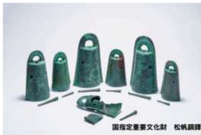
国指定重要文化財 松帆銅鐸

このたび、南あわじ市で発見された「松帆銅鐸」が、国の重要文化財に指定されることが決定しました。さらに、淡路島日本遺産認定10周年という記念すべき節目を迎えます。これらを記念し、淡路島の歴史と文化の深さを実感できる日本遺産認定10周年特別展「国指定重要文化財 松帆銅鐸と地域の宝」を開催いたします。弥生時代のロマンと、地域の誇りを再発見する貴重な機会に、ぜひご来場ください。