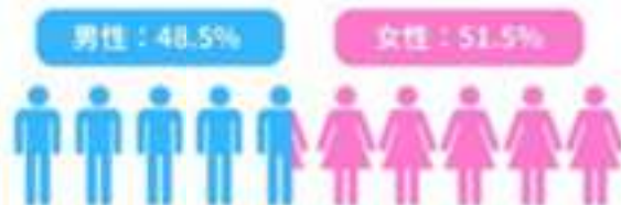
フレイル外来の受診比率（年代別、男女別）

フレイル外来は、令和5年度の事業開始から令和7年度末までに、累計で実人数232人が受診しています。令和7年度の受診者を見ると、受診者の性別は男性48.5%、女性51.5%であり、一般的な介護予防事業と比べても、男性の参加割合が高いことが特徴です。年代別では、60歳代が23.5%、70歳代が41.2%、80歳代が35.3%となっており、70歳代を中心に、80歳代まで幅広く利用されています。