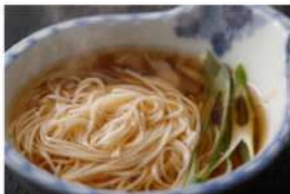
「鱧すきのゆのそうめん」