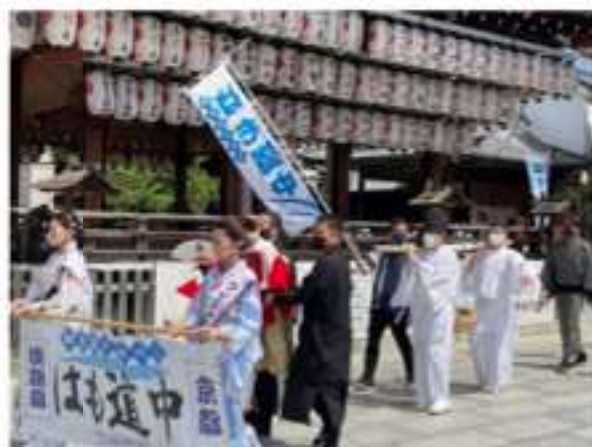
八坂神社での「はも道中」の様子

◆ 昨年の「はも道中」の様子 は、下記QRコードからご覧ください。 YouTube「 第17回 はも道中 」で検索