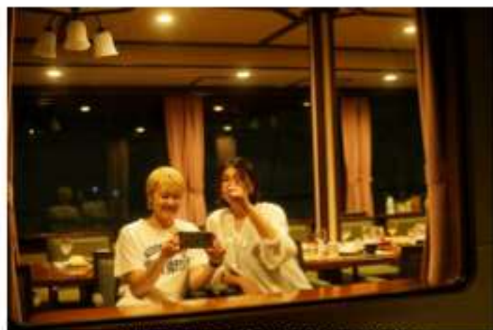
船内から見える夜景をお楽しみください