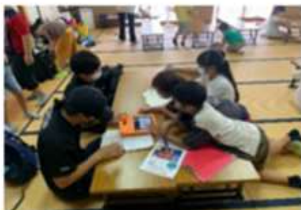
アフタースクールの様子（動画制作）