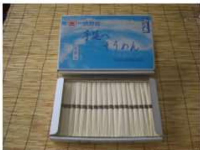
淡路手延べそうめん 御陵系