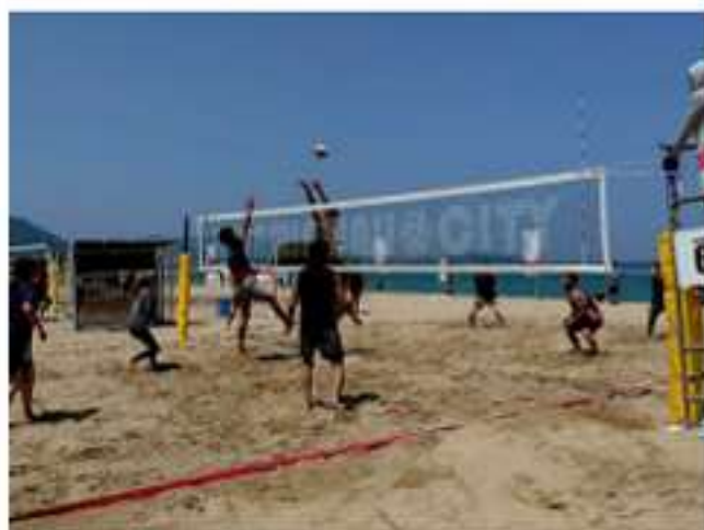
過去に慶野松原で開催された ビーチバレーボール大会の様子