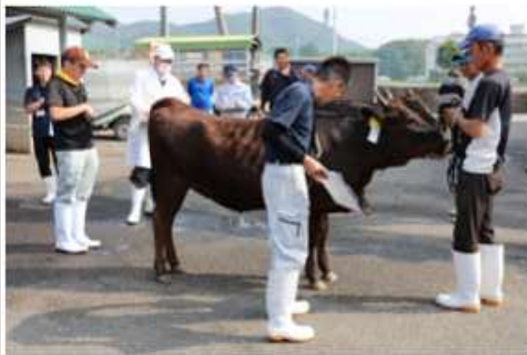
育成牛管理指導会の様子