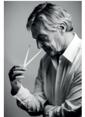
調香師 ジャン＝クロード・エレナ