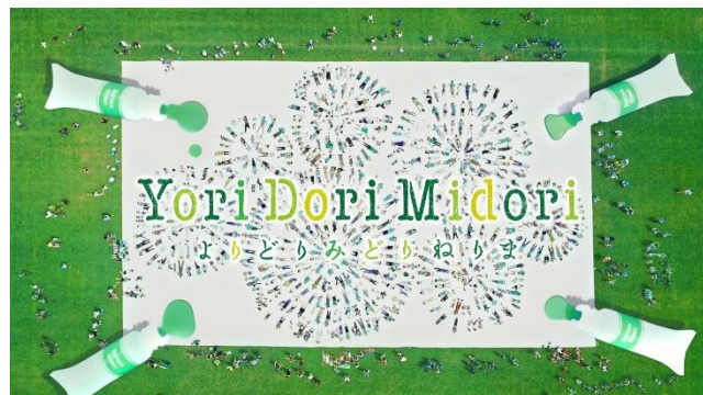
【TV-CM「グリーンアート篇」カット画像】

絵具として実物化された「NERIMA GREEN（5色）」は今後、区のイベントなどプロモーションに使用され、様々な場所で活用していく予定です。