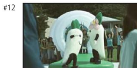
囲まれたこの街では、