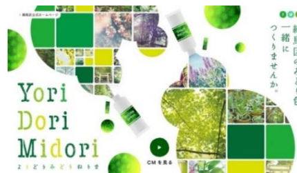
【Yori Dori Midori 練馬】プロジェクト キービジュアル

プロジェクトサイト: http://www.yoridorimidori-nerima.jp 練馬区公式ホームページ: http://www.city.nerima.tokyo.jp/