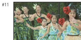
NA) たくさんの“みどり”に