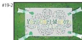
NA) よりどりみどり練馬