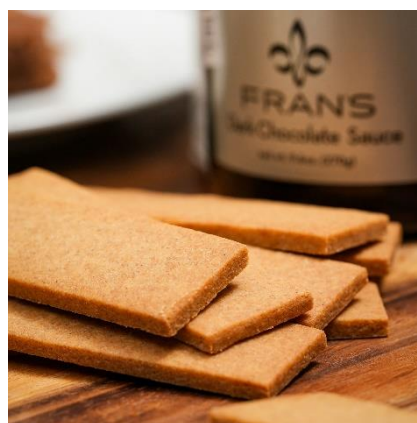
ダークチョコレートソースセット

今年のホワイトデーコレクションでは、フランズチョコレートの定番“デザートソース”をセットにした「ギフト BOX」を販売。カカオ本来の力強さとクリームの深い甘さが広がる ダークチョコレートソース やなめらかで奥行きのある甘さの キャラメルソース の2種類よりお選びいただけます。