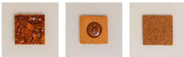
左から「フロランタン」「キャラメルサンド」「スペキュロス」

缶を開けた瞬間からクッキーの華やかな香りが広がり、選ぶ時間さえもわくわくするひとときに。自分へのご褒美や大切な方への贈り物にもふさわしいひと品です。