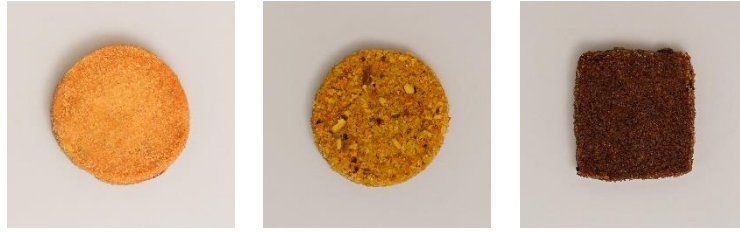
左から「メープルくるみ」「ピスタチオサブレ」「チョコレートサブレ」