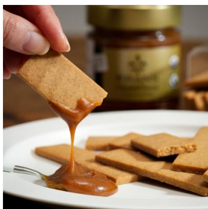
キャラメルソースセット

京都産小麦を使用したビスケットは、ほのかな甘みと香ばしく軽やかな食感が後を引くおいしさ。シンプルだからこそ素材の上質さが引き立つひと品です。