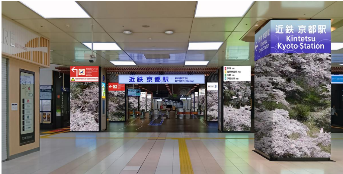
(画像はイメージです)