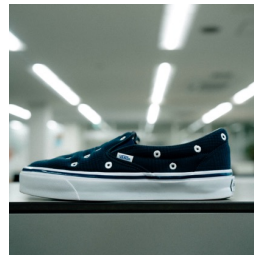
PREMIUM SLIP-ON (TDC DARK NAVY/MULTI)