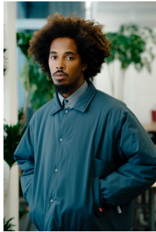
REVERSIBLE PUFF COACH JACKET (DARK SHADOW) 品番:VN000KES40X 自店販売価格: ¥19,250