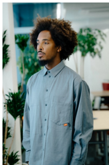
GLENN CHECK SHIRTS (CROCKERY) 品番:VN000KF240X 自店販売価格: ¥15,400