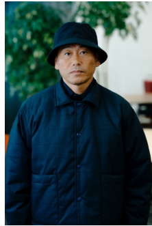
REVERSIBLE PUFF COACH JACKET (NAVY BLAZER) 品番:VN000KESB06 自店販売価格: ¥19,250