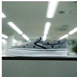
PREMIUM SLIP-ON (TDC ASPHALT/MULTI)