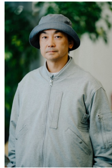
SWEAT MA-1 JACKET (GREY HEATHER) 品番:VN000KETGRH 自店販売価格: ¥29,150