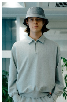
HALF ZIP SWEAT SHIRTS (GREY HEATHER) 品番:VN000KF3GRH 自店販売価格: ¥14,850