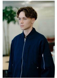
SWEAT MA-1 JACKET (NAVY BLAZER) 品番:VN000KETB06 自店販売価格: ¥29,150