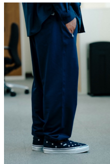
SWEAT PANTS (NAVY BLAZER) 品番:VN000KF5B06 自店販売価格: ¥13,750