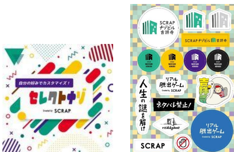
(画像：左から、自分好みでカスタマイズ！セレクトナゾ、ステッカーシート)

SCRAP ナゾビル吉祥寺： https://www.scrapmagazine.com/nazobldg_kichijoji/