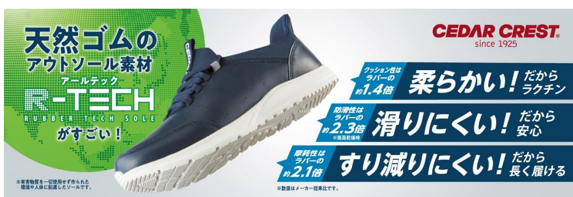
「店頭販促」イメージ