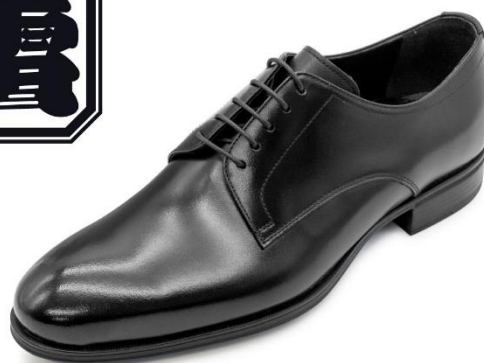
【プレーントゥ】 蕾 TE02T ¥20,900（税込） アッパー：牛革 24.5～27.0cm