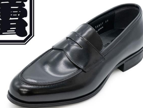
【ローファー】 蕾 TE03T ¥20,900（税込） アッパー：牛革 24.5～27.0cm

アッパーにはLWG認証（※）を受けた姫路の老舗タンナーが製造するガラスレザーを使用。靴内の空気を外へ循環させるイタリア製の空気循環ソールや、ソールのラバー材質と内部構造による柔らかくクッション性の高い履き心地など、高い機能性を搭載しながらも本格的な紳士靴としてはリーズナブルな価格を実現した、MADE IN JAPANのシューズです。