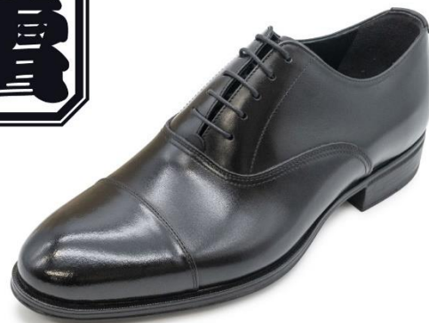
【ストレートチップ】 蕾 TE01T ¥20,900（税込） アッパー：牛革 24.5～27.0cm